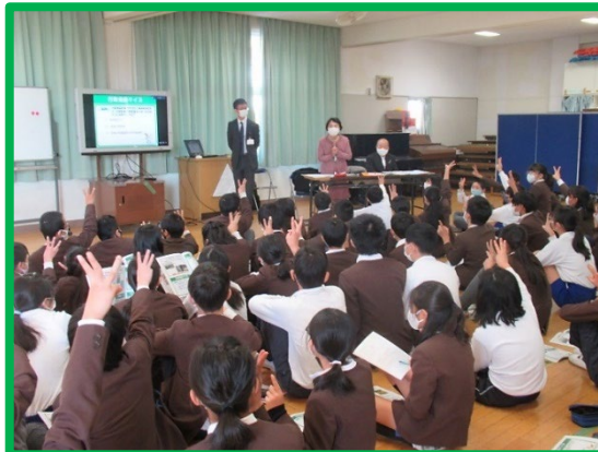
クイズに答える子どもたち