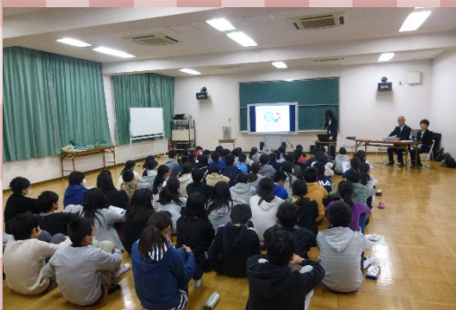
▲熱心に聞き入る子どもたち

行政についての知識が広がった。10ページに載っていた幼稚園に年少の時にいて、こんな身近なところで行政相談が行われていることに驚いた。年少の時、ずっと狭いと思っていたので、今は広がって良くなったと思います。