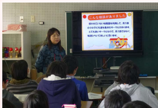
▼実際にあった相談を紹介する安田委員